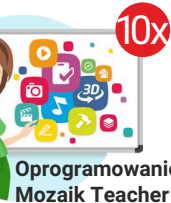
Oprogramowanie Mozaik Teacher

Całkowita wartość zadania (wnioskowana kwota wsparcia finansowego plus wkład własny – suma wkładu finansowego i rzeczowego) wraz z procentowym udziałem dotacji i wkładu własnego