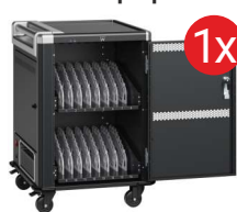
Mobilna stacja ładująca EWENT dla 16 laptopów