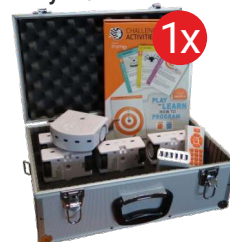
Zestaw szkolny Thymio RF