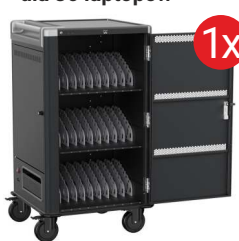
Mobilna stacja ładująca EWENT dla 36 laptopów