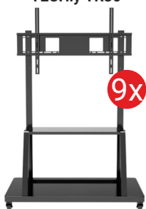
Podstawa do monitora TECHly TR30