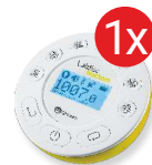
Dysk pomiarowy Labdisc Fizyka