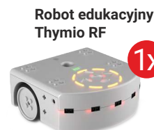
Robot edukacyjny Thymio RF