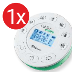
Dysk pomiarowy Labdisc Środowisko