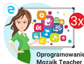
Oprogramowanie Mozaik Teacher

Całkowita wartość zadania (wnioskowana kwota wsparcia finansowego plus wkład własny – suma wkładu finansowego i rzeczowego) wraz z procentowym udziałem dotacji i wkładu własnego