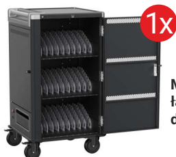
Mobilna stacja ładująca EWENT dla 30 laptopów