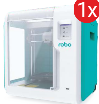
Drukarka 3D robo E3