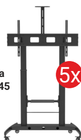
Podstawa do monitora TECHly TR45