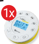
Dysk pomiarowy Labdisc Biochem