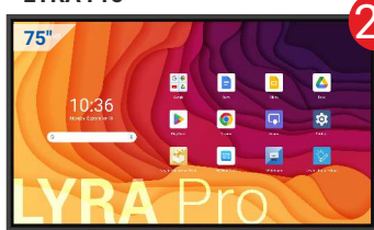
Monitor interaktywny LYRA Pro