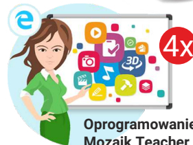
Oprogramowanie Mozaik Teacher