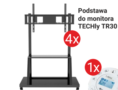
Podstawa do monitora TECHly TR30