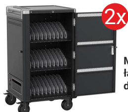
Mobilna stacja ładująca EWENT dla 30 laptopów