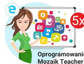
Oprogramowanie Mozaik Teacher

Całkowita wartość zadania (wnioskowana kwota wsparcia finansowego plus wkład własny – suma wkładu finansowego i rzeczowego) wraz z procentowym udziałem dotacji i wkładu własnego