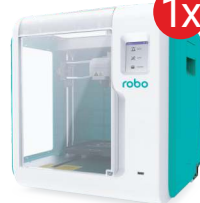
Drukarka 3D robo E3