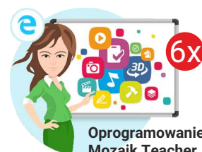
Oprogramowanie Mozaik Teacher

Całkowita wartość zadania (wnioskowana kwota wsparcia finansowego plus wkład własny – suma wkładu finansowego i rzeczowego) wraz z procentowym udziałem dotacji i wkładu własnego