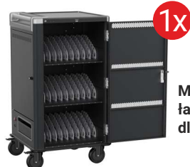
Mobilna stacja ładująca EWENT dla 30 laptopów