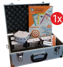
Zestaw szkolny Thymio RF