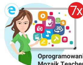
Oprogramowanie Mozaik Teacher

Całkowita wartość zadania (wnioskowana kwota wsparcia finansowego plus wkład własny – suma wkładu finansowego i rzeczowego) wraz z procentowym udziałem dotacji i wkładu własnego